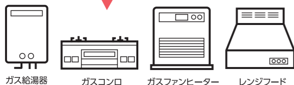
ガス給湯器 ガスコンロ ガスファンヒーター レンジフード

こんなにたくさんの機器が 月々 4,000円(税込) で あなたのお家に設置できます！