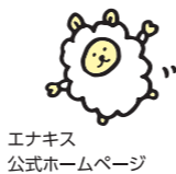
エナキス 公式ホームページ