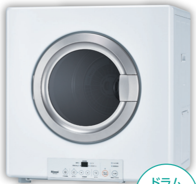
RDT-54S-SV 乾燥容量 5.0kg